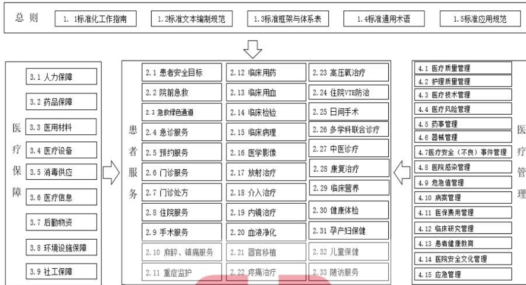
图2 《中国医院质量安全管理》团体标准体系结构框架