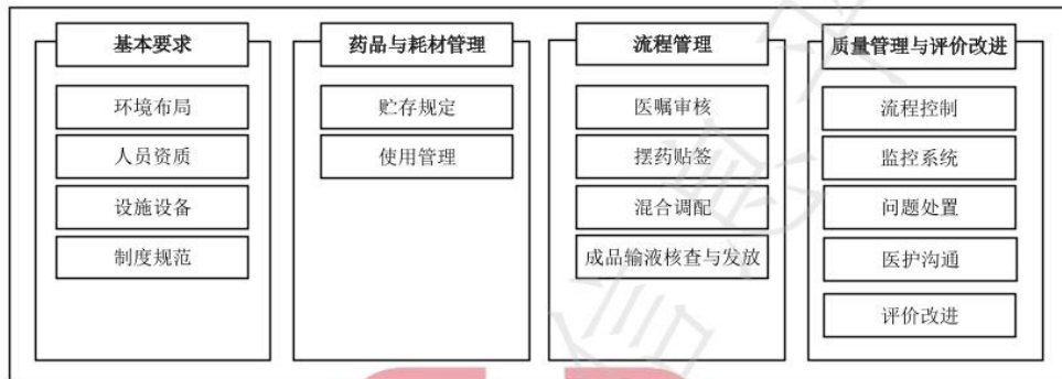
图1 静脉用药集中调配关键要素