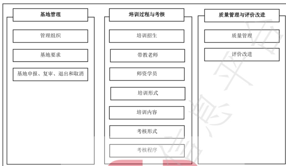
图1 临床药师师资培训关键要素